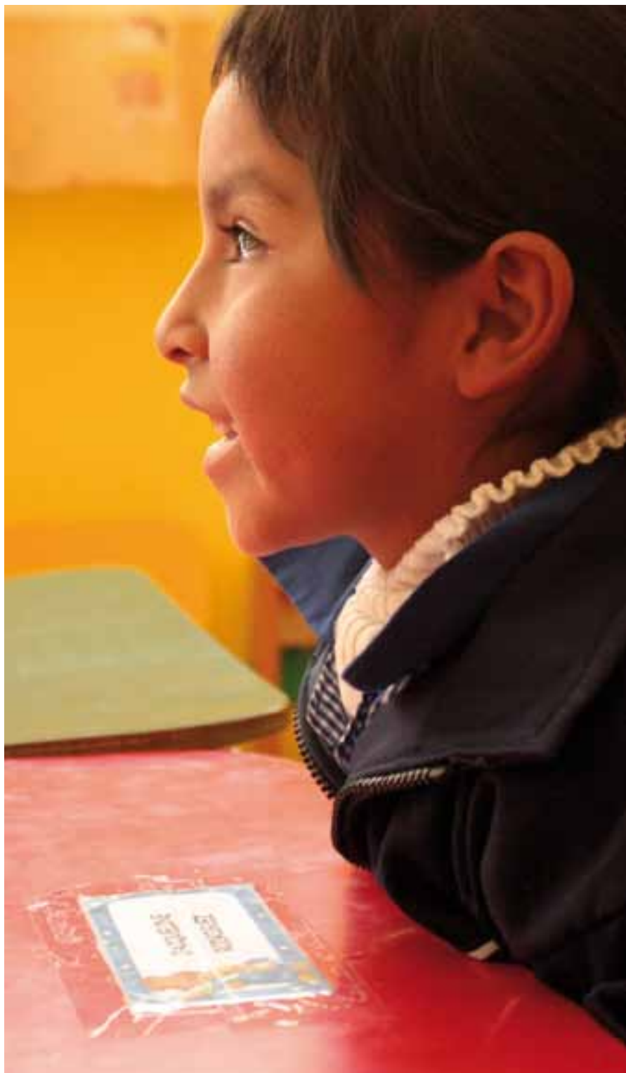
Hora del cuento, Camiña

El consorcio japonés está encabezado por Mitsui & Co., Ltd., una de las mayores compañías de trading de la nación nipona, y comprende a las compañías Nippon Mining & Metals Co., Ltd. y Mitsui Mining & Smelting Co., Ltd.