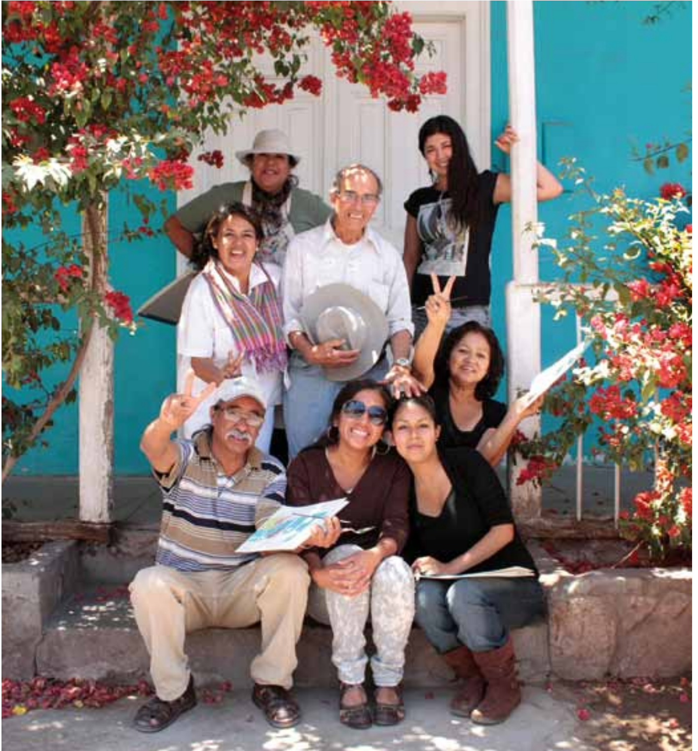
Taller color, Pica