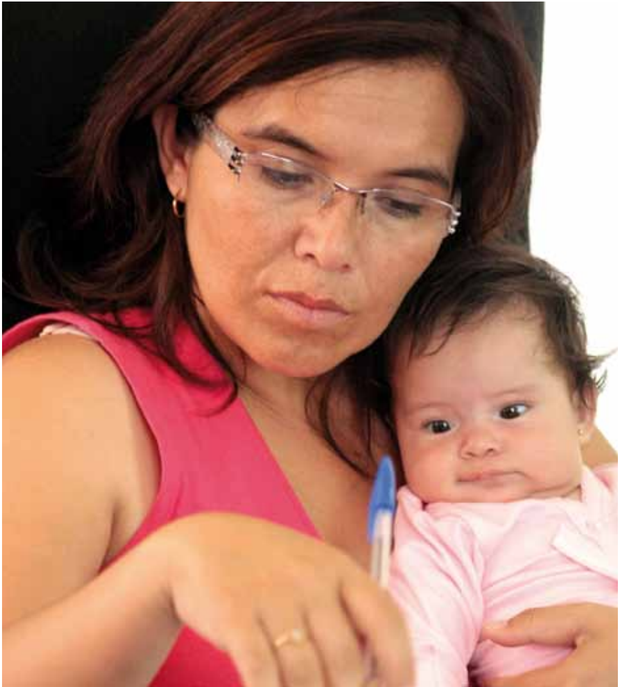
Capacitación a emprendedores, Pica

como en el de otros insumos como bolas y revestimientos para molino, la Compañía ha diversificado sus suministradores de manera de reducir el riesgo de dependencia en ellos.