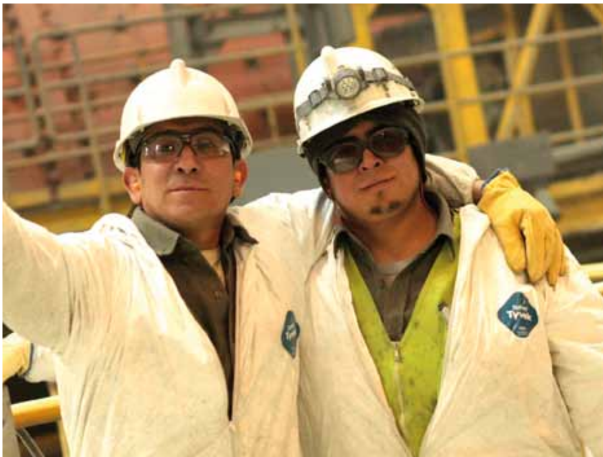
Trabajadores de la planta concentradora