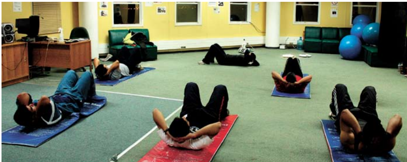
La práctica de ejercicio físico es una buena forma de cuidar el corazón.