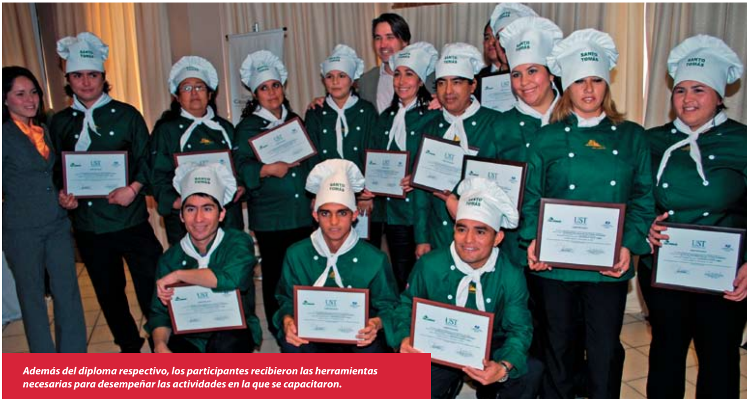
Además del diploma respectivo, los participantes recibieron las herramientas necesarias para desempeñar las actividades en la que se capacitaron.