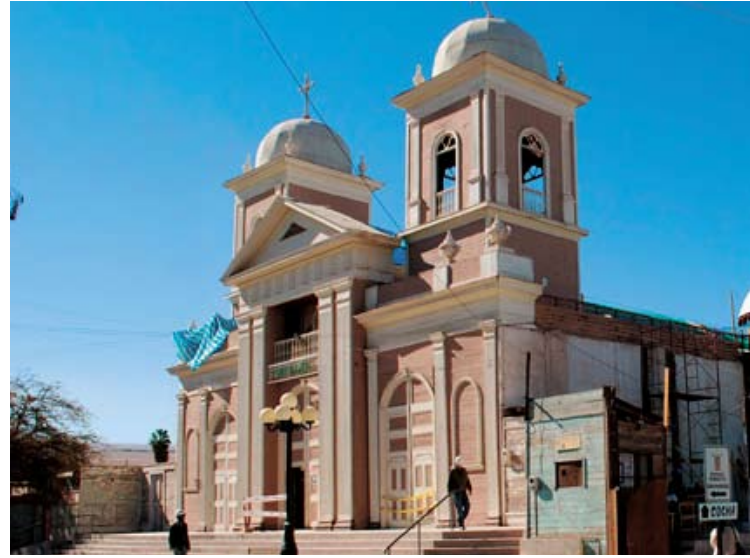
Para la fiesta de San Andrés, que se celebra el 30 de noviembre, se contará con los interiores del templo, quedando algunos detalles de los exteriores para esa fecha.