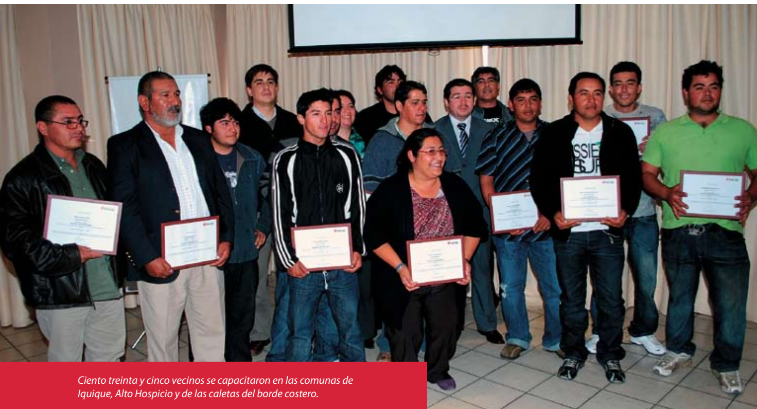
Ciento treinta y cinco vecinos se capacitaron en las comunas de Iquique, Alto Hospicio y de las caletas del borde costero.

Los cursos forman parte del Programa de Becas Sociales de Collahuasi a través de la Franquicia Tributaria Sence, cuya finalidad es generar capacidades que permitan a las personas independizarse y emprender.