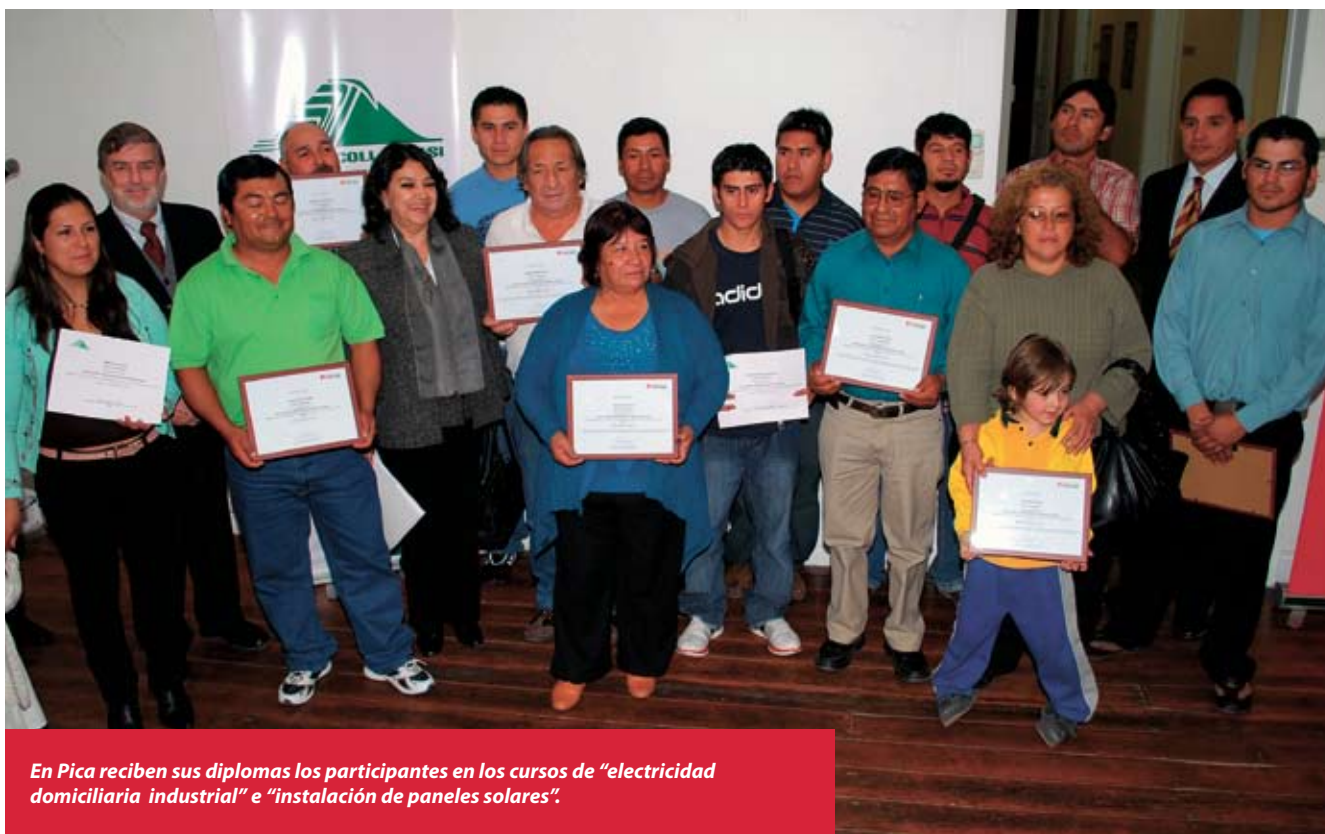
En Pica reciben sus diplomas los participantes en los cursos de "electricidad domiciliaria industrial" e "instalación de paneles solares".

Vecinos de Tarapacá aplauden capacitación recibida por Sence y Collahuasi en 2010