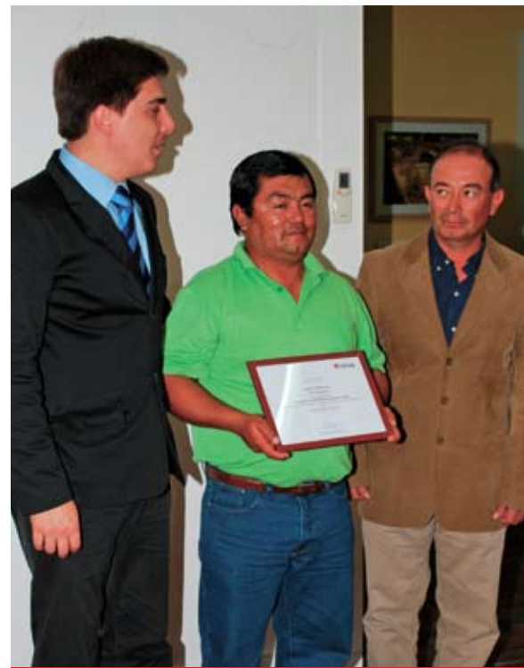
Como el gran favorito se constituyó el curso de "instalación de paneles solares" realizado en Pica.

Cabe destacar que desde el año 2003 Collahuasi coordina junto al Sence el Programa de Becas Sociales con franquicia tributaria, a fin de mejorar la calidad de vida de los habitantes de la región, proporcionándoles la oportunidad de aprender un oficio que les permita ser innovadores y forjadores del futuro. Ello, en el marco de su compromiso con la Responsabilidad Social Empresarial.